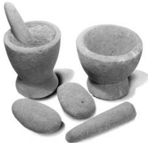
Bron 4: Stampers en kommen van basalt.