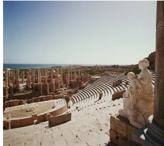
Bron 10: Leptis Magna in het tegenwoordige Libië.