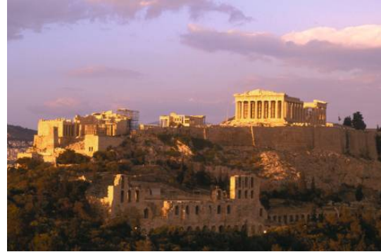
Bron 7: De Atheense Akropolis na de herbouw door Pericles.

Enkele vrienden van Plato waren volgelingen van de wetenschapper Pythagoras. Pythagoras dacht dat de kosmos volgens bepaalde getalsverhoudingen was geordend. In het dagelijks leven wilde hij ook orde scheppen en heeft met zijn volgelingen in enkele stadstaten geregeerd. Ze regeerden als een groep wijze mannen.