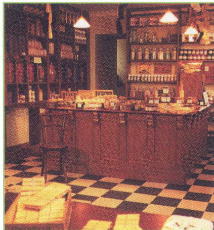
De winkel (nagebouwd van de winkel in 1820).