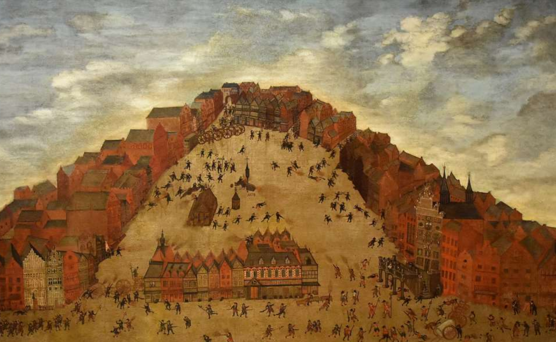
GESIGT VAN DE MARKT VAN HEFTOGENBOSCH MET HET GEVECT ALDAER TUSSEN DE BURGERS EN HET SCHERMERS-GILDE VOORGEVALLEN DEN 1 JULY 1679.