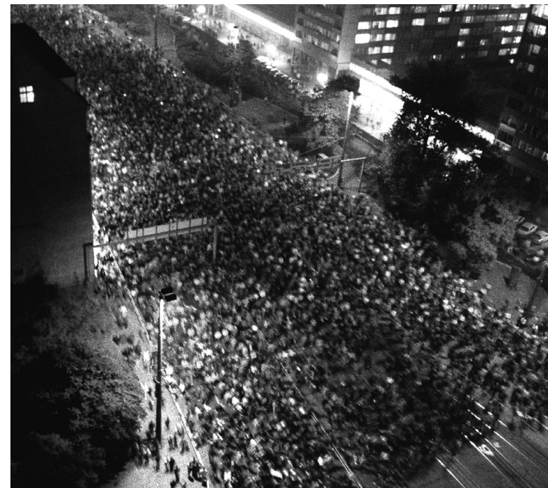
Gewelddoze 'maandagdemonstratie' in Leipzig, met 70.000 deelnemers.

Stel voor het maken van je presentatie of krantenartikel een onderzoeksvraag voor jezelf op. Dat is natuurlijk een historische onderzoeksvraag die begint met 'waarom' of 'hoe'. Bij het maken van je presentatie of krantenartikel bespreek je de historische gebeurtenis, zoek je er extra details over op en ga je in op de oorzaken en gevolgen van deze gebeurtenis. Zorg ook voor passend beeldmateriaal!