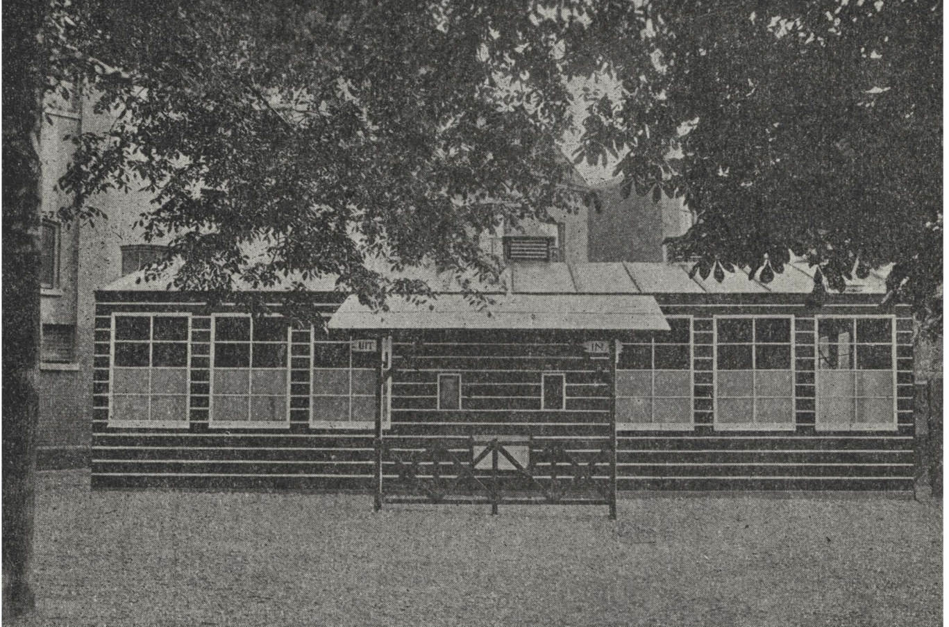
Bron 2. Foto gebouw centrale keuken

Uit: Utrecht en de oorlogstoestand IV. Mededeelingen betreffende de levensmiddelenvoorziening van de gemeente Utrecht over het tijdvak mei 1917-februari 1918 (Utrecht 1918), no. 7, p. 14