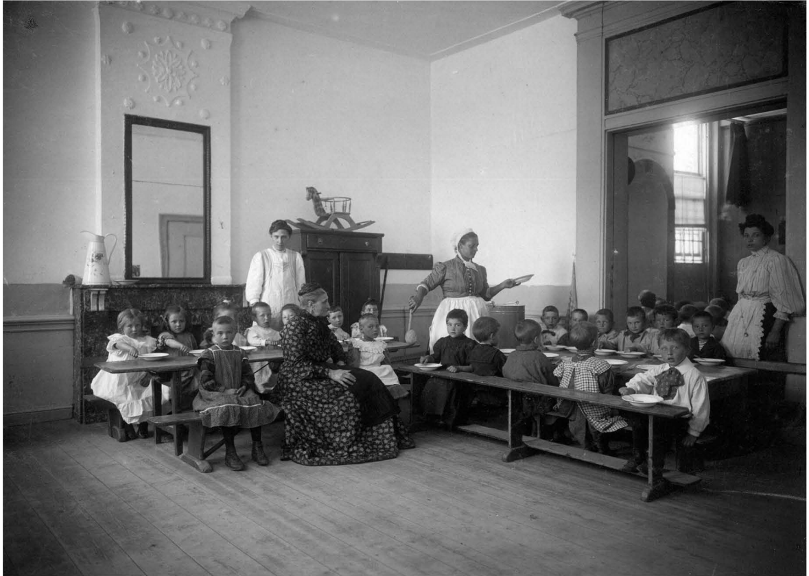
Bron 4. Foto van het verstrekken van schoolvoeding op de Bijzondere School voor Lager Onderwijs Achter St. Pieter 14 (Haveloozenschool) ca. 1916 Uit: Collectie Beeldmateriaal Het Utrechts Archief, catalogusnr. 121061