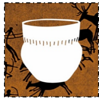
Jagers en boeren Tot 3.000 v. Chr.