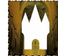
Steden en staten 1000 - 1500