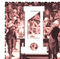
Pruiken en revoluties 1700 - 1800