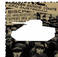
Wereldoorlogen 1900 - 1950