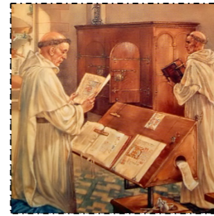
Monniken en ridders 500 - 1000