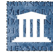
Grieken en Romeinen 3.000 v. Chr. – 500 n. Chr.