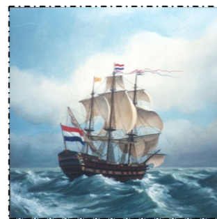
Ontdekkers en hervormers 1500 - 1600