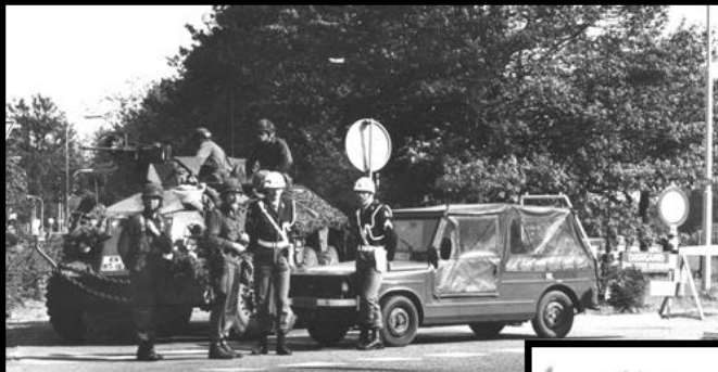
Mobiele eenheid bij De Punt, 1977