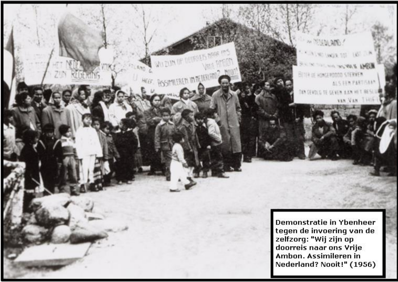
Demonstratie in Ybenheer tegen de invoering van de zelfzorg: "Wij zijn op doorreis naar ons Vrije Ambon. Assimileren in Nederland? Nooit!" (1956)