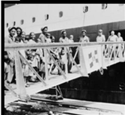
De overtocht van Java naar Nederland met Molukse militairen, vrouwen en kinderen op de Atlantis, februari 1951