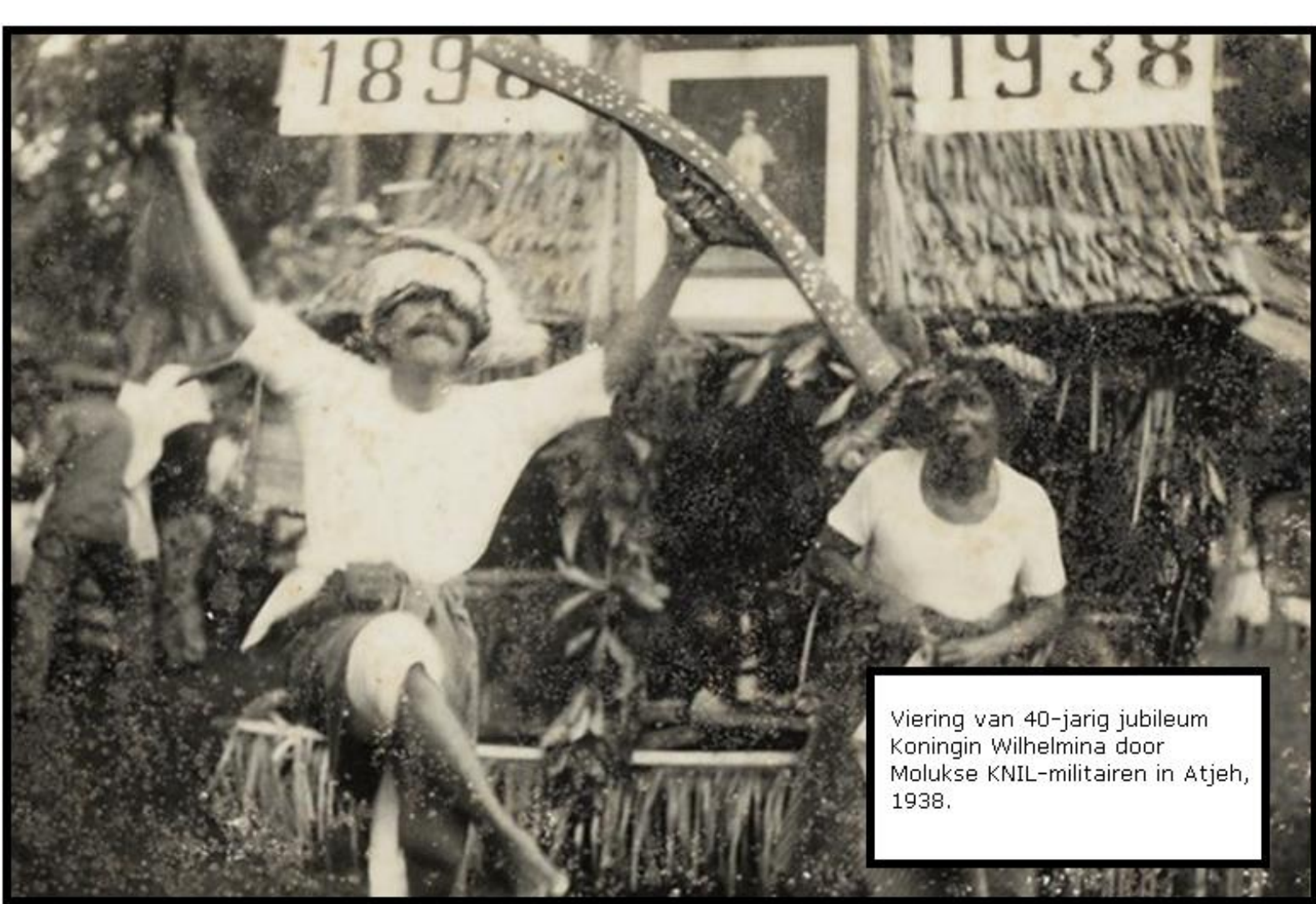
Viering van 40-jarig jubileum Koningin Wilhelmina door Molukse KNIL-militairen in Atjeh, 1938.