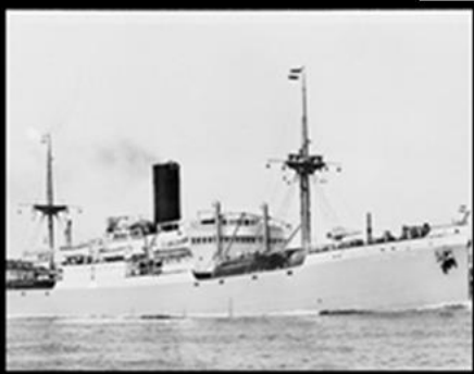
De Kota Inten kwam op 21 maart 1951 als eerste boot aan in Rotterdam