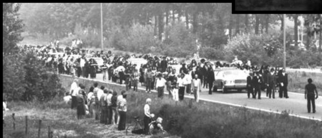
Begrafenis van de overleden gijzelnemers