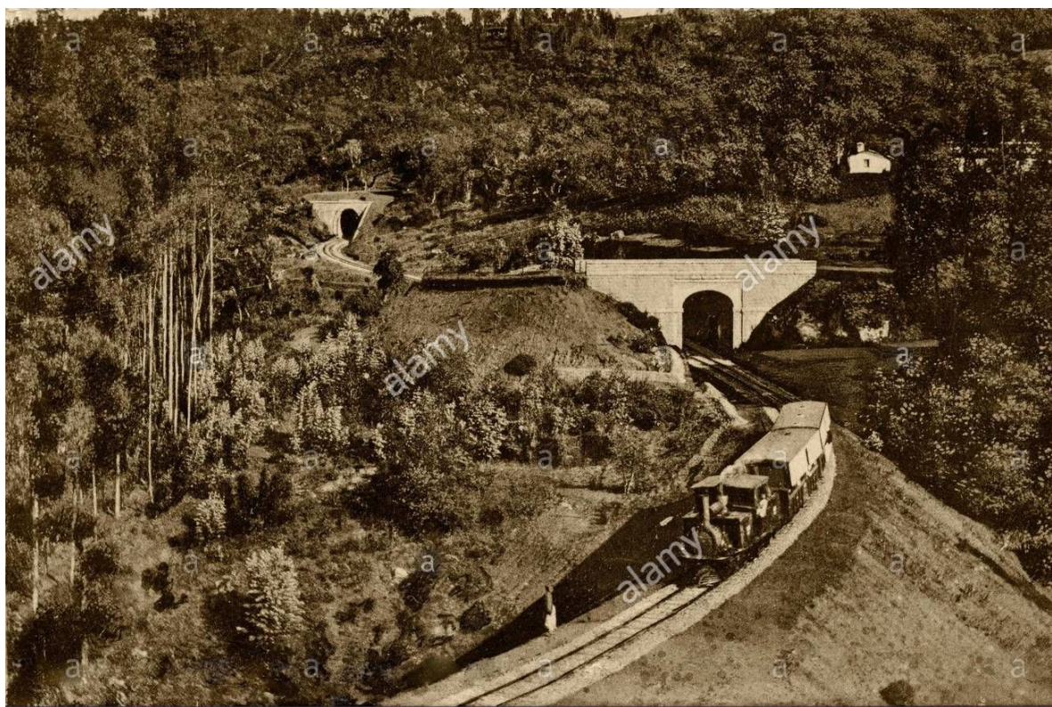
Foto van een stoomtrein bij de Lovedale tunnel, Ooty, Tamil Nadu, India