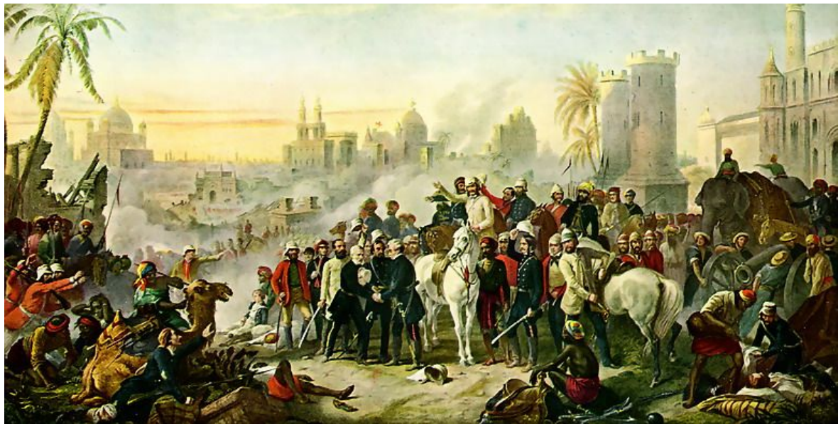
The Relief of Lucknow , by Thomas Jones Barker

“Whereas the Right Honourable Robert Lord Clive, baron Clive of Plassey, Companion on the most Honourable Order of the Bath, Major General and Commander of the Forces, President of the council and Governor of Fort-William, and of all the settlements belonging to the united Company of Merchants of England trading to the East Indies in the provinces of Bengal, Behar, and Orissa (...) are invested with full and ample powers , on the behalf of his Excellency the Nabob Najim al Dowlah, Subahdar of Bengal, Bahar, and Orissa, and likewise on behalf of the united Company of Merchants of England trading to the East Indies, to negotiate, settle, and finally to conclude a firm and lasting peace with his Highness the Nabob Sujah al Dowlah, Vizier of the Empire : Be it known to all those to whom it may or shall in any manner belong, that the above-named plenipotentiaries have agreed upon the following articles with his Highness.”