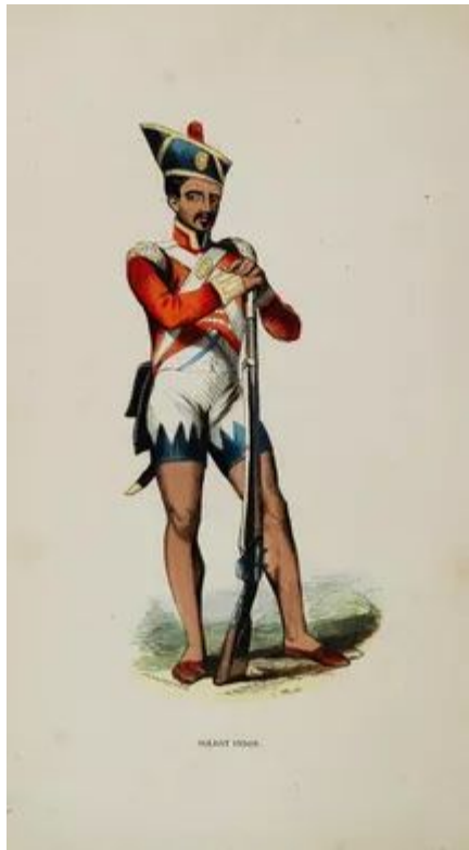
A Company sepoy, in an engraving, with original hand coloring, by Auguste Wahlen